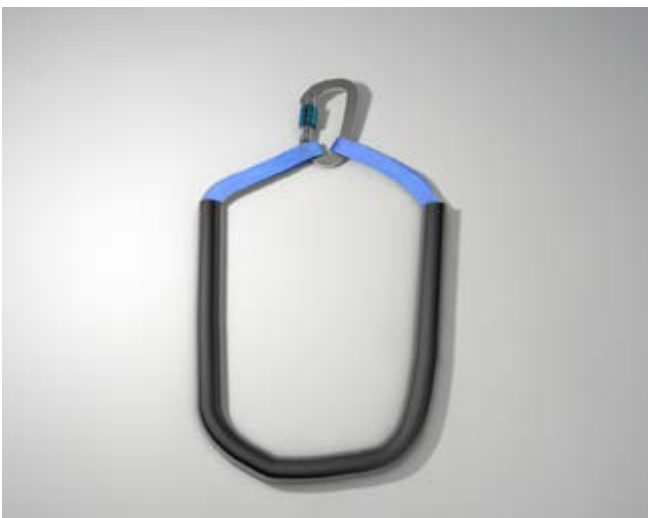
Abb. 16 Kantengeschütztes Anschlagmittel

Anschlagmittel müssen unter Berücksichtigung der jeweiligen Anwendungsform (z. B. Umschlingen eines Bauteils, Kantenbeanspruchung) in Anlehnung an DIN EN 795 baumustergeprüft sein. Werden als Anschlagmittel Verbindungselemente verwendet, müssen diese den Festigkeitsanforderungen nach DIN EN 362 entsprechen.