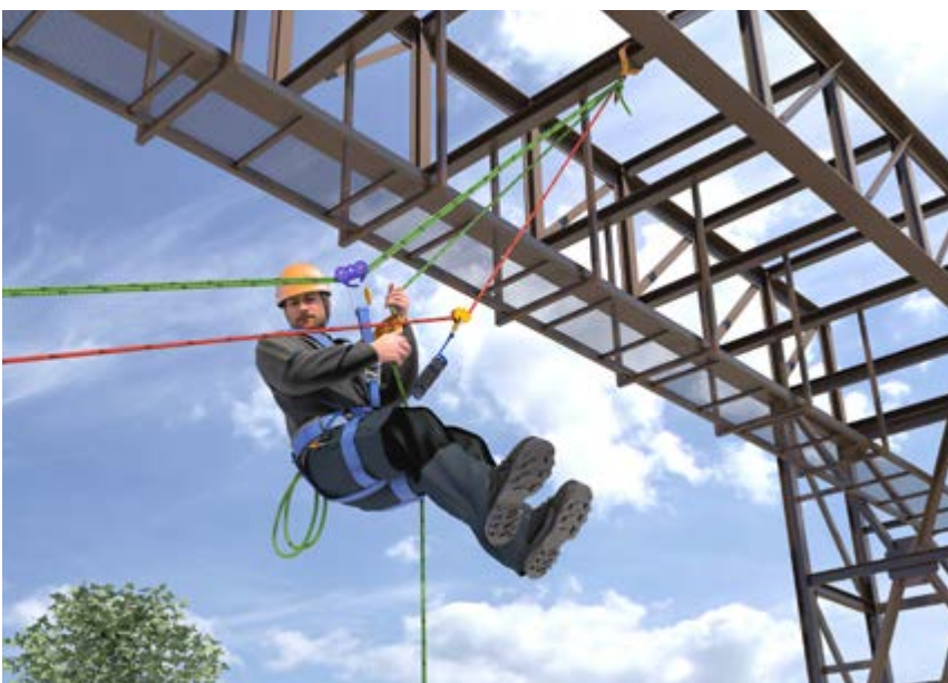
Abb. 12 SZP horizontale oder diagonale Hauptbewegungsrichtung