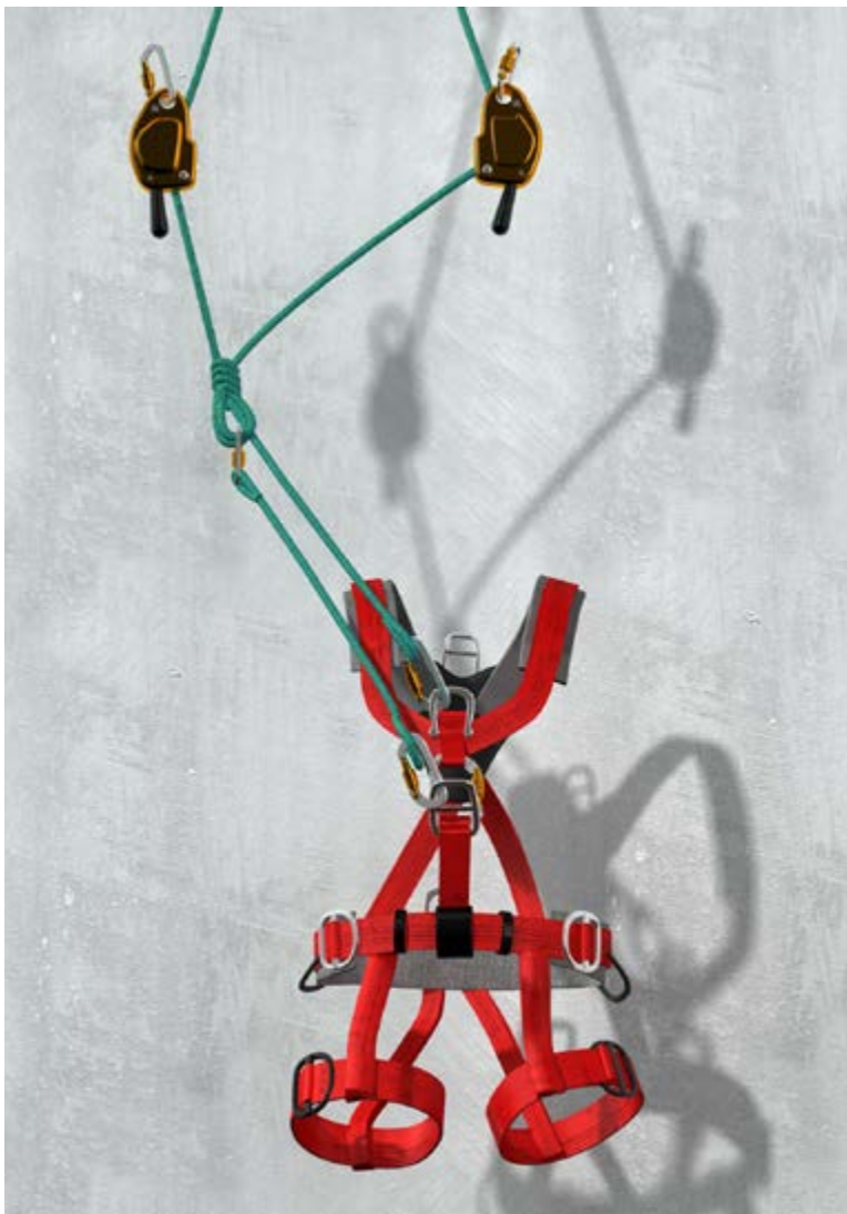
Abb. 15 Hinweis zur passiven Positionierung