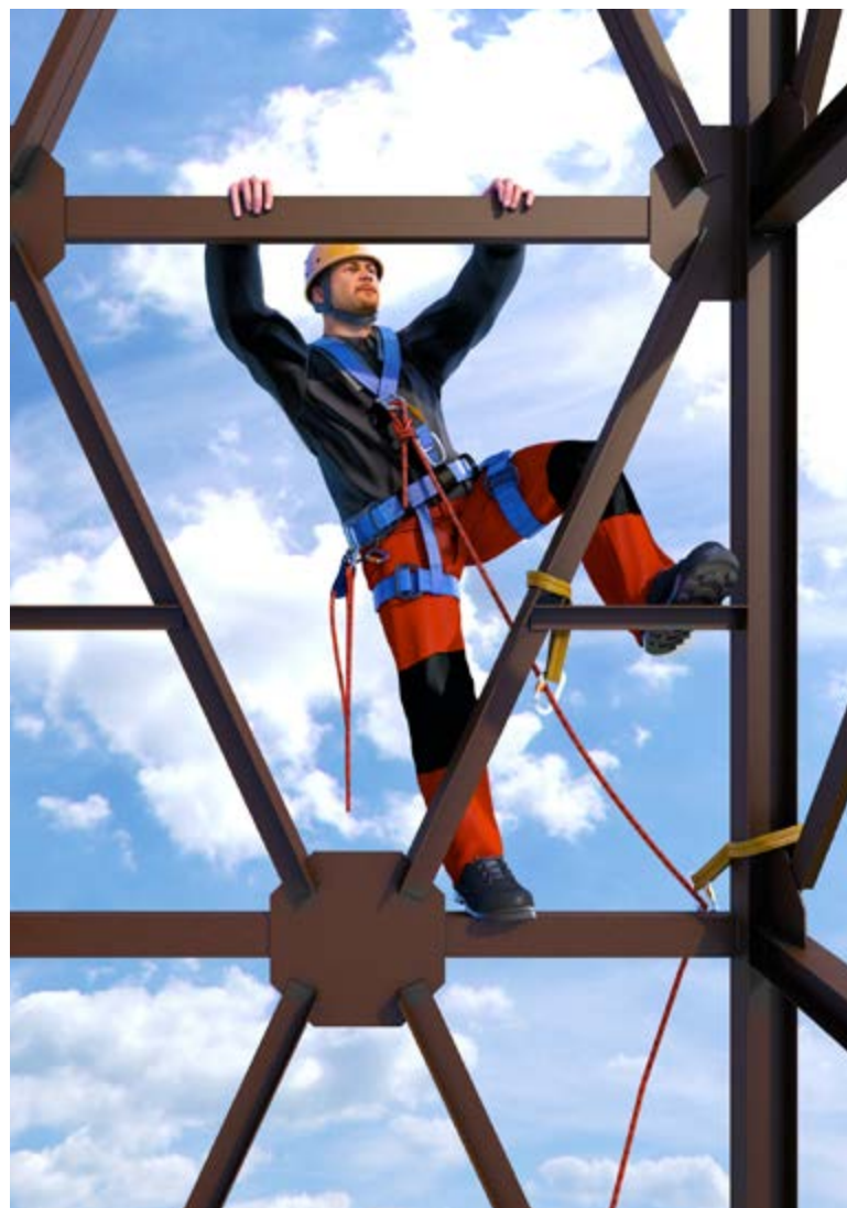
Abb. 14 Vorstieg an einer Rohrbrücke