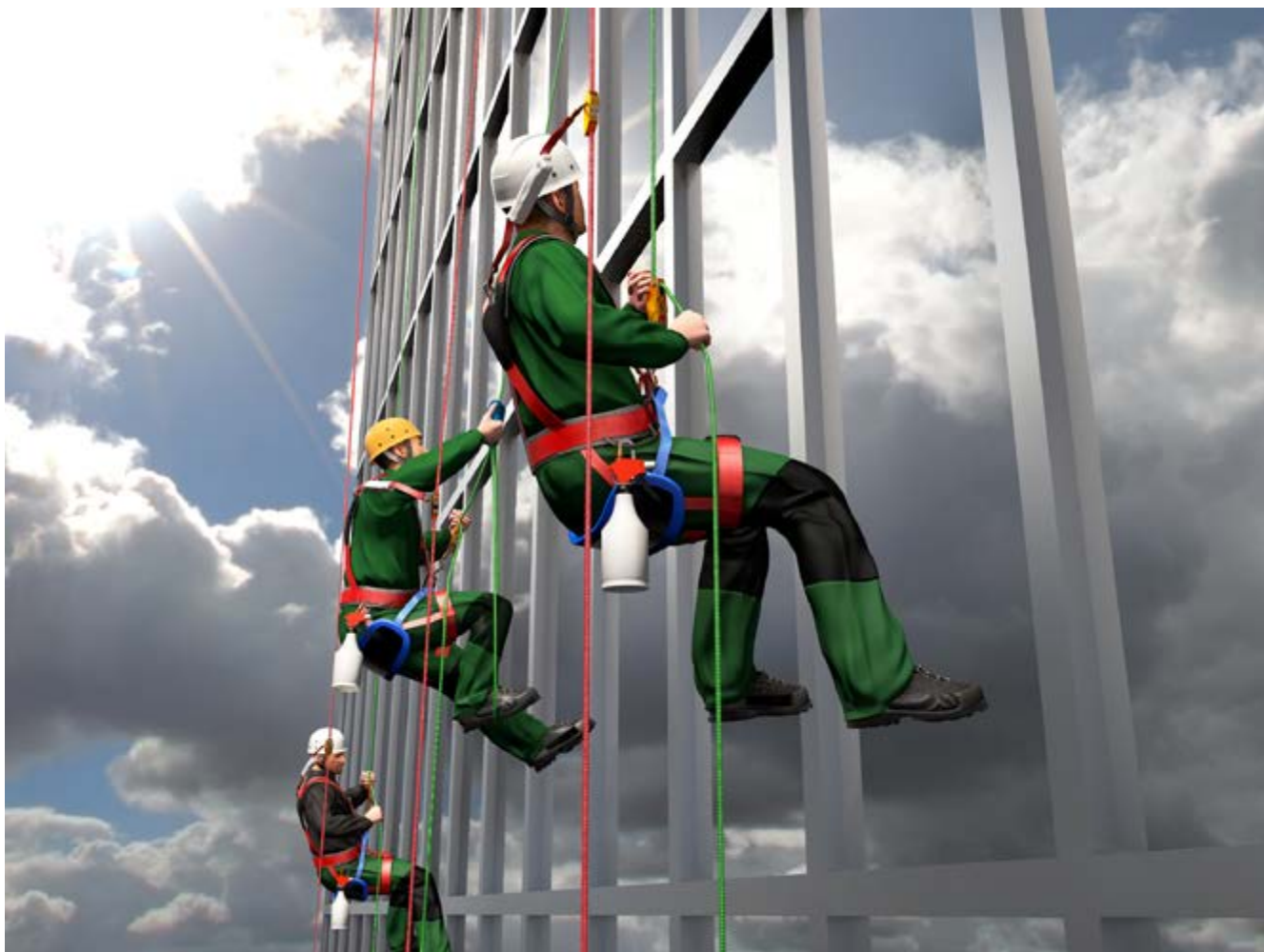
Abb. 9 SZP vertikale Hauptbewegungsrichtung