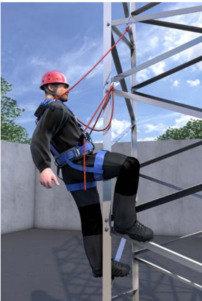
Abb. 7 Positionieren durch Verwendung von PSaG/Absturzschutzsystem