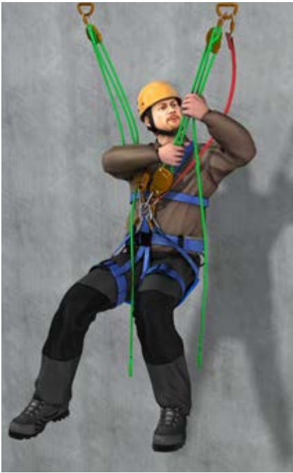
Abb. 10 a SZP horizontale Hauptbewegungsrichtung