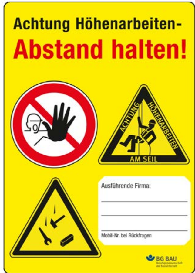
Abb. 18 Kennzeichnung der Arbeitsstelle

Zur Sicherung von Arbeitsstellen im Bereich des öffentlichen Verkehrsraumes sind die Richtlinien für die Sicherung von Arbeitsstellen an Straßen (RSA) in der aktuellsten Fassung zu beachten.