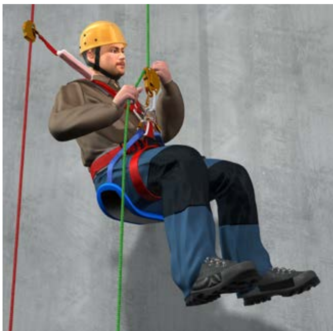
Abb. 2 Beispiel einer ergonomisch gestalteten Sitzfläche