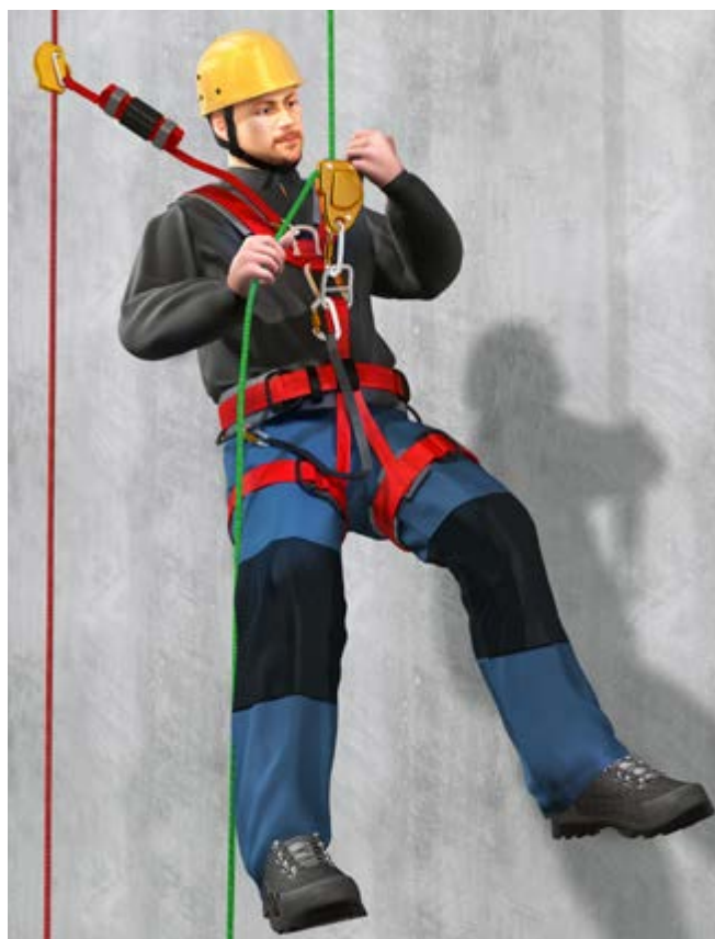
Abb. 4 Beispiel eines geeigneten Auffanggurtes

Strukturen sind Teile von Bauwerken oder Konstruktionen, die sich zur Fortbewegung bzw. zum Sichern eignen, z. B. Stahlträger, Verstrebungen oder Pfeiler.