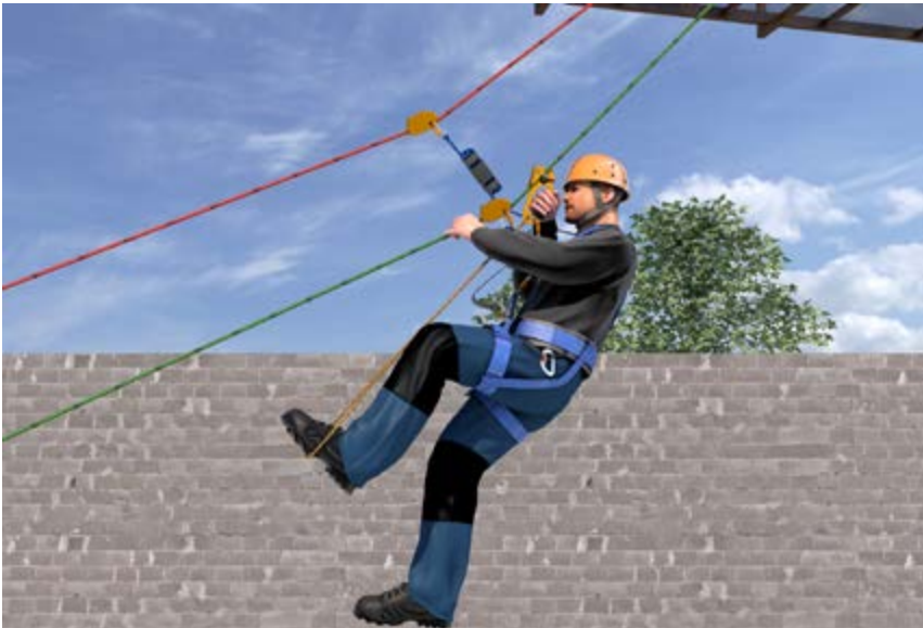
Abb. 11 SZP horizontale oder diagonale Hauptbewegungsrichtung