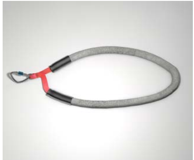
Abb. 17 kantengeschützte vorkonfektionierte Schlinge

Typische Anschlagmittel sind z. B. Gurtbandschlingen, textile Spanngurte, Stahlseilschlingen, Karabiner.