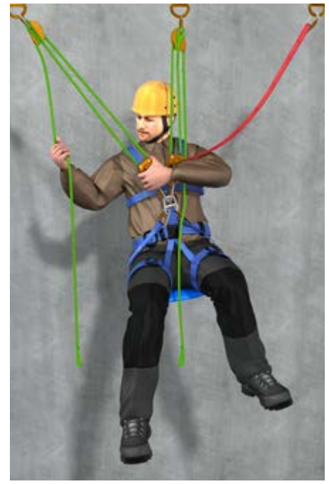
Abb. 10 c SZP horizontale Hauptbewegungsrichtung