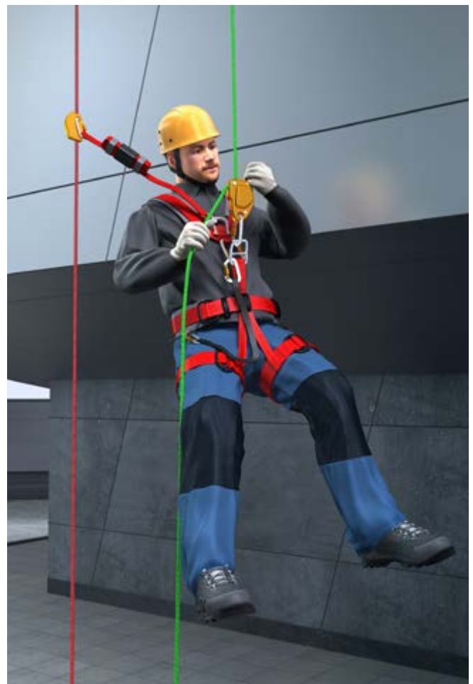
Abb. 8 Verwendung von SZP