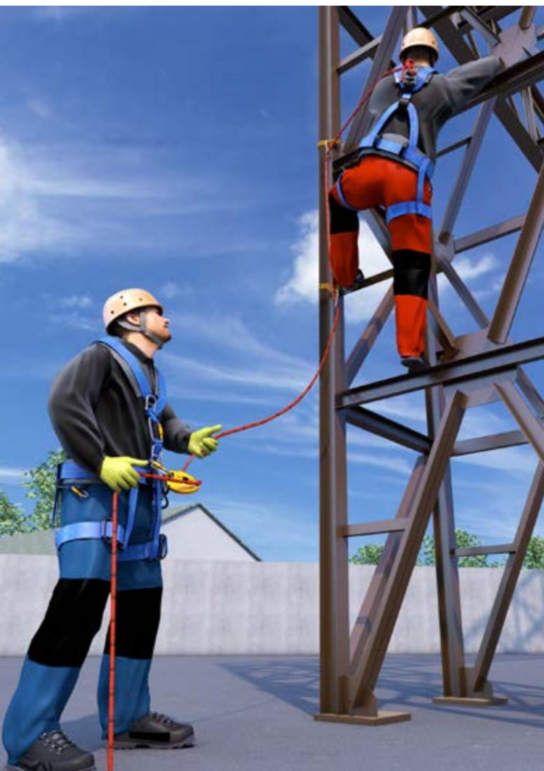
Abb. 13 Vorstieg an einer Rohrbrücke