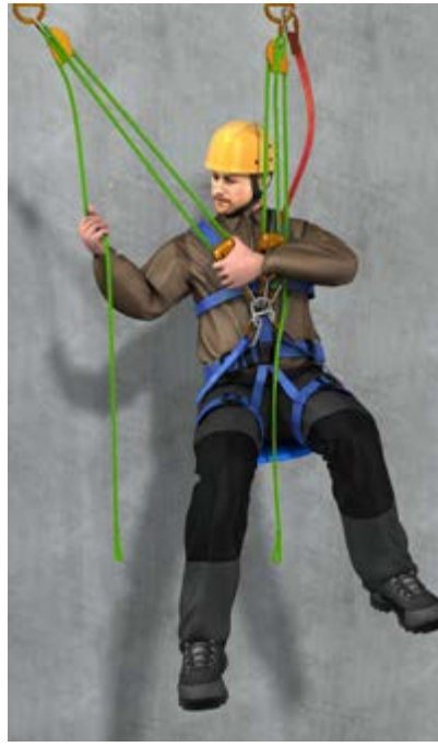
Abb. 10 b SZP horizontale Hauptbewegungsrichtung