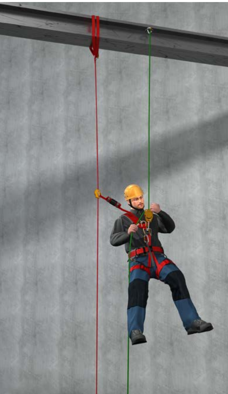
Abb. 1 Systemredundanz : unabhängig voneinander angeschlagenes Tragseil (hier grün) und Sicherungsseil (hier rot).

Arbeiten unter Verwendung von seilunterstützten Zugangs- und Positionierungsverfahren (SZP) sind alle Verfahren, bei denen die Anwender und Anwenderinnen sich an Seilen oder Verbindungsmitteln als Trag- und Sicherungssystem, redundant gesichert, horizontal, diagonal oder vertikal fortbewegen und/oder positionieren (siehe Abbildung 1).