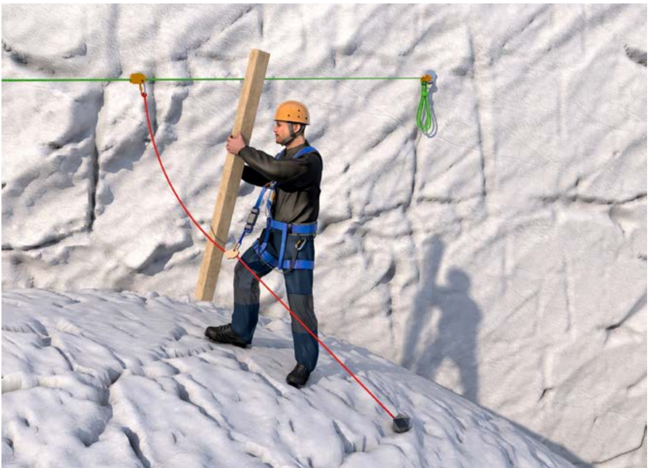
Abb. 5 Verwendung von PSAgA/Absturzschutzsystem

PSAgA ist ein Sicherungssystem (Absturzschutzsystem), welches bei der Fortbewegung unter Verwendung eines nicht planmäßig belasteten Verbindungsmittels eingesetzt wird (siehe Abbildungen 5 und 7).