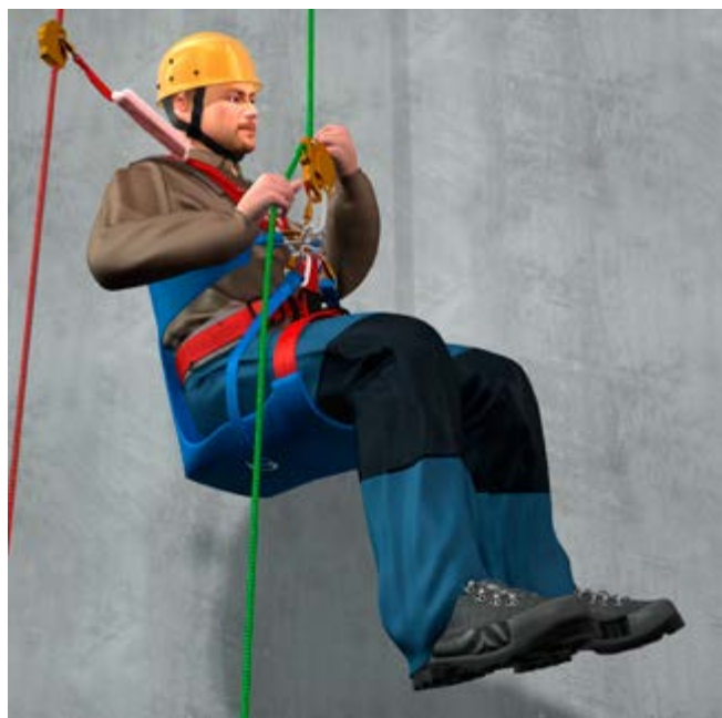
Abb. 3 Beispiel eines Gurtsystems mit integriertem Sitz

(siehe Abbildung 4). Zur Körperhaltevorrichtung gehört deren Befestigung mit der Seileinstellvorrichtung.